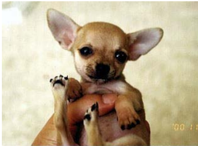
我家に来た頃のフォーチュン。 オテ手がしっかりしています。お鼻が真っ黒。このページのTOP

小さいから色々あったけど、基本的に元気者…。 フォーチュンが 小さいから 色々言われたりして気分わる～い事もあったけど、 フォーチュンのおかげで 心暖かい人ともいっぱい巡り会えた。 フォーチュンの存在そのものにありがとう…です。