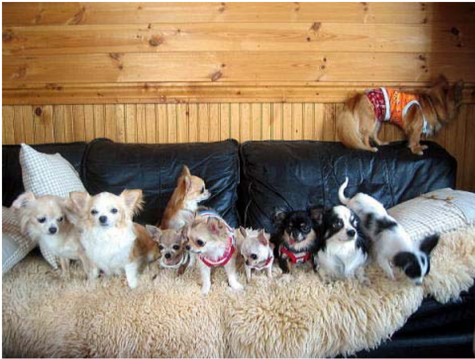
おっ くつきーちゃん 見っけ！！ソファの背もたれに登ってる子です。