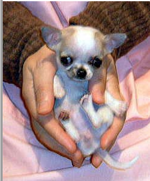
左フォーチュン・こちらら~ちゃん ともに、同じ生後80日前後の姿。 このページのTOPへ