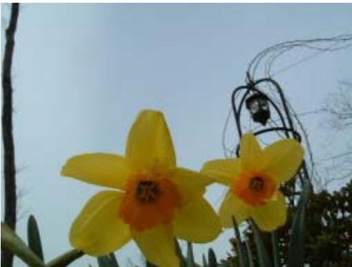
水仙「フォーチュン」です。

身長が10~13cmぐらいのチューリップです。 手前のパンジーと背比べしてます。