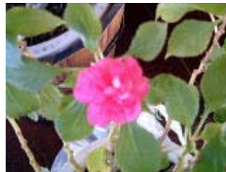
薔薇咲きインパチェンス

春は もうすぐだから……ね。春になったら 庭に戻してあげるから、それまでもう少し お部屋の中で頑張っってね……。って 声をかけてあげた……。