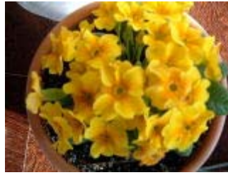
プリムラジュリアン