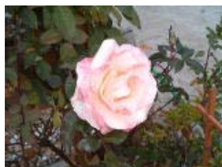
右: ローゼンドルフシュパリーポップ

この頃気になってること……。 道路の走行中の車…。昔私が 免許を取ったとき「キープ・レフト」と習った。