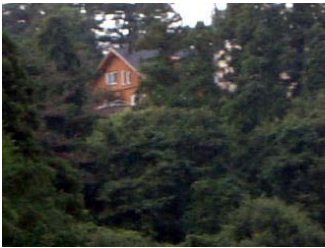
隠し田から見たまほら。