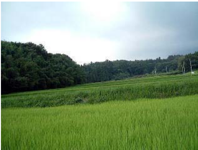
のんびりとした隠し田風景