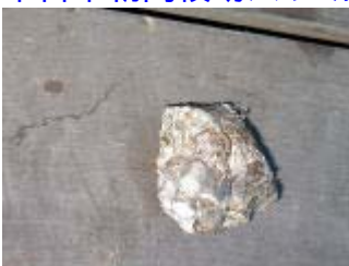
落ちてきたのを撮影。

そんな訳で 朝、様子を見ると戦う戦士のいない城となった蜂の巣を 本日早朝高枝切バサミにてチョン！！